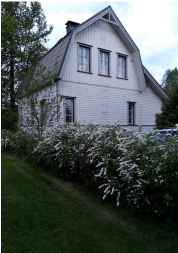
Kuva 2 Onteron talo

Talon kunnostukseen ja ylläpitoon on käytetty lukemattomia työtunteja. Talo tunnetaan nykyisin nimellä Villalong ja se on omistajiensa käytössä sekä talvella että kesällä.